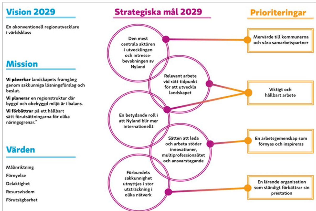
Bild 1 Nylands förbunds strategi.

Landskapsfullmäktige godkände i december 2019 en strategi som fastställer riktningen för hur Nylands förbund leds och hur det agerar under strategiperioden, som löper tio år framåt till år 2029.