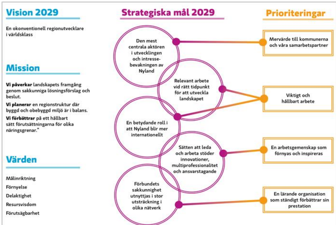
Bild 1 Nylands förbunds strategi.

Landskapsfullmäktige godkände i december 2019 en strategi som fastställer riktningen för hur Nylands förbund leds och hur det agerar under strategiperioden, som löper tio år framåt till år 2029.